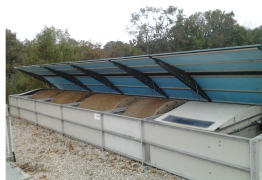
Station d'épuration à disques biologiques

Nous consulter pour une recherche d'aide au financement.