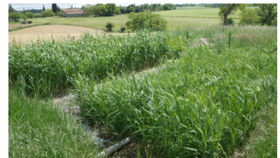
Filtre planté de roseaux