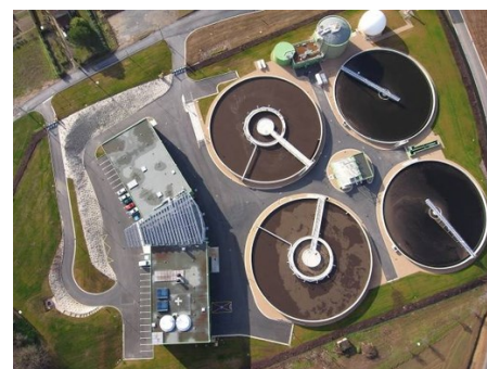
Vue aérienne d'une STEU à boues activées

Nous consulter pour une recherche d'aide au financement.