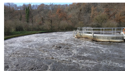
Bassin d'aération d'une STEU à boues activées