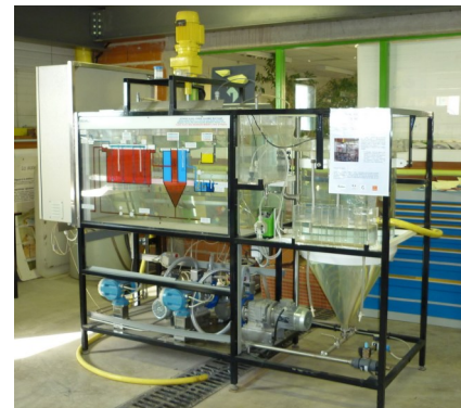
Pilote de station d'épuration à boues activées (PFT GH 2 O)

Aspects réglementaires relatifs au traitement des effluents et à l'élimination des boues.