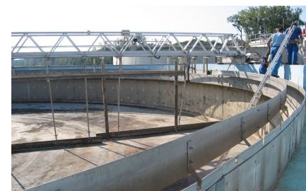
Clarificateur d'une STEU à boues activées